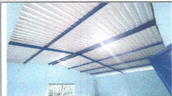
foto 1: Sustitución de lámina, por lámina troquelada aluzinc calibre 26 En modulo de Cocina