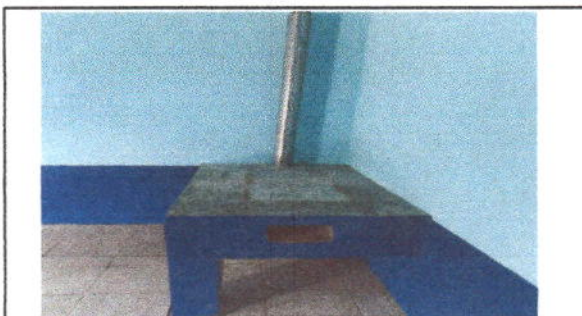
foto 6: Sustitución de estufa rural (completa) incluye chimenea y plancha de metal En modulo de Cocina