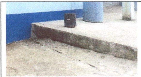
foto 4: Sustitución de piso de torta de concreto En modulo de Cocina